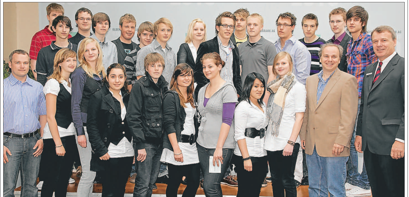
Einblick in die Wirtschaftswelt: Die Schülerinnen und Schüler des Wirtschaftsgymnasiums Oldenburg besuchten die Hauptversammlung der Oldenburgischen Landesbank.