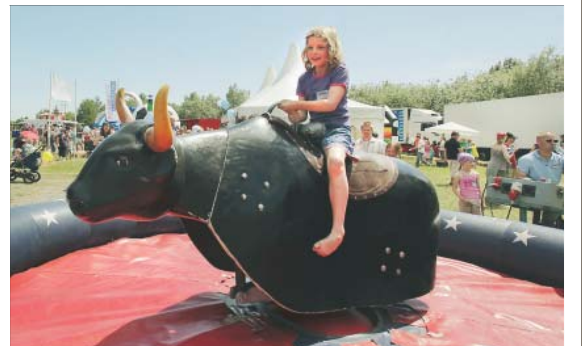
Auf dem Abenteuer-Bauernhof der Molkerei Ammerland war auch Geschicklichkeit gefragt: So galt es, sich beim Bullen-Reiten zu bewähren. Viele schafften es ohne Abwurf.