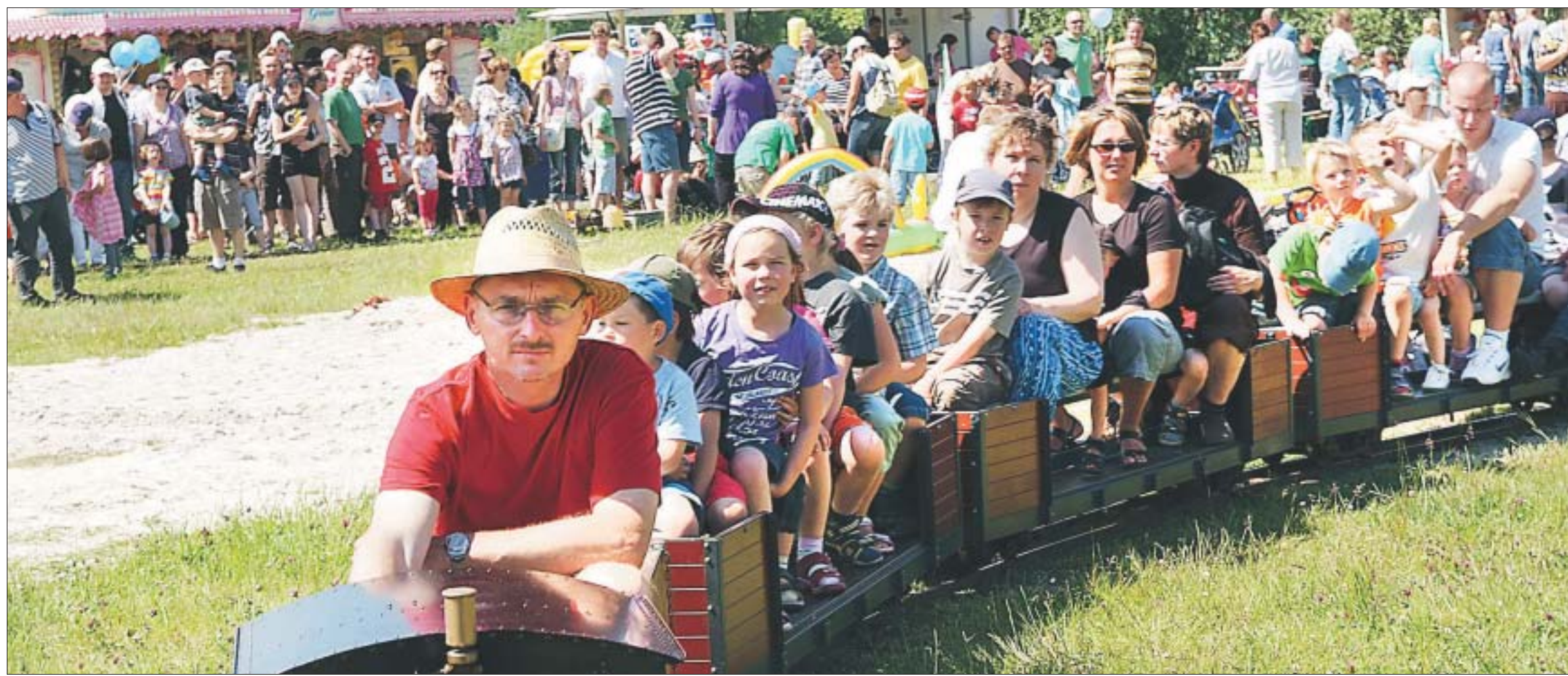
Seit Jahren ein beliebter Teil des Familienfestes: Eine gemütliche Rundfahrt auf der Mini-Bahn durch das Gelände neben der Oldenburger Weser-Ems-Halle.

Die Rutsche war klasse, da ging es total schnell runter, das war super. Außerdem waren wir Torwandschießen. Da hab ich auch getroffen. Meine Schwester war Ponyreiten, das war auch gut. Eigentlich gefällt uns das ganze Fest mit den vielen Attraktionen total gut. Gleich gehen wir auf das Trampolin. Nico (8) und Senikka (4) Bockhorn