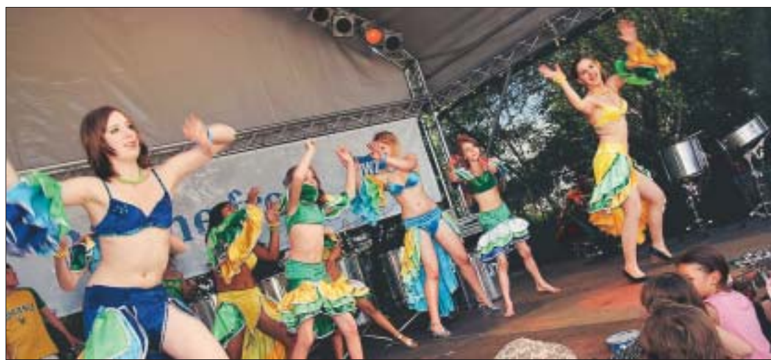
Tolle Stimmung herrschte bei der Aktion „Bühne frei“, wo unterschiedlichste Hobbykünstler auftraten – hier eine Oldenburger Samba-Schule.

Berichte und Bilder vom Familienfest unter www.NWZonline.de/familienfest NWZTV berichtet unter www.NWZonline.de/nwztv