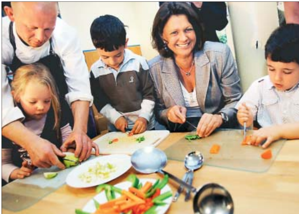
Ernährungsministerin Ilse Aigner (CSU) stellte in einer Kindertagesstätte in Köln Qualitätsstandards für die Verpflegung in Tageseinrichtungen vor.

sollen Kinder zwischendurch zu geschnittenem Obst und Gemüse greifen. Statt Pizza und Burger am Mittag stehen Kartoffeln, Getreide, mageres Fleisch oder Fisch auf dem Plan. Die Herkunft von Wurst und Fleisch müsse den Standards zufolge auf dem Speise-